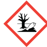
Aquatic Chronic 2