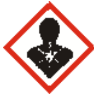
Carc. 2 Niebezpieczeństwo