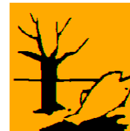
Produkt niebezpieczny dla środowiska